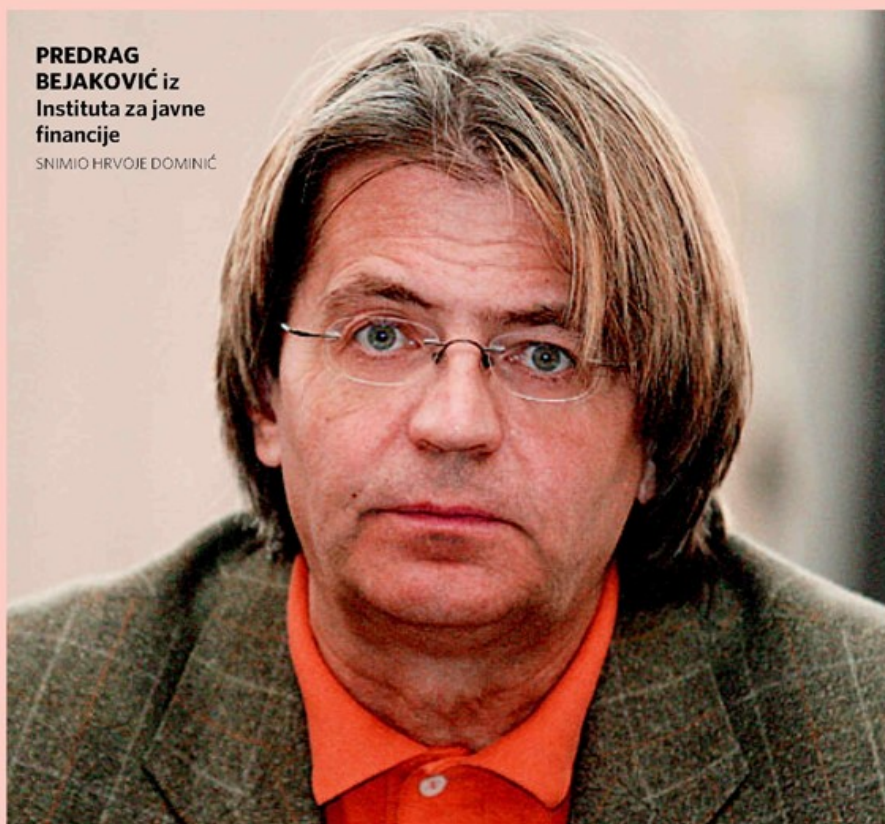
PREDRAG BEJAKOVIĆ iz Instituta za javne financije

» Unutarnja struktura mirovinskog sustava je bolesna, stalno se nešto ispravlja