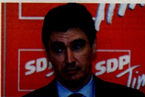
Zoran Milanović, pozdravio je Vladine mjere za oštru penalizaciju prijevremenog umirovljenja

Mladahne sudionice moje "fokus grupe" vjeruju kako njima neće trebati takve kompenzacije i drago im je ako su aktualne promjene znak da je polustoljetni vrijednosni sustav na izdisaju. Tek počinju svoj radni vijek, jednako dug kao i njihovi partneri, pa će u skladu s tim planirati, ne samo karijeru nego i obitelj. One znaju da mogu i moraju izabrati, što je velika razlika u odnosu na prethodne generacije, kojima stoga treba zaštita i naknada države. Na koji telefon da one nazovu?