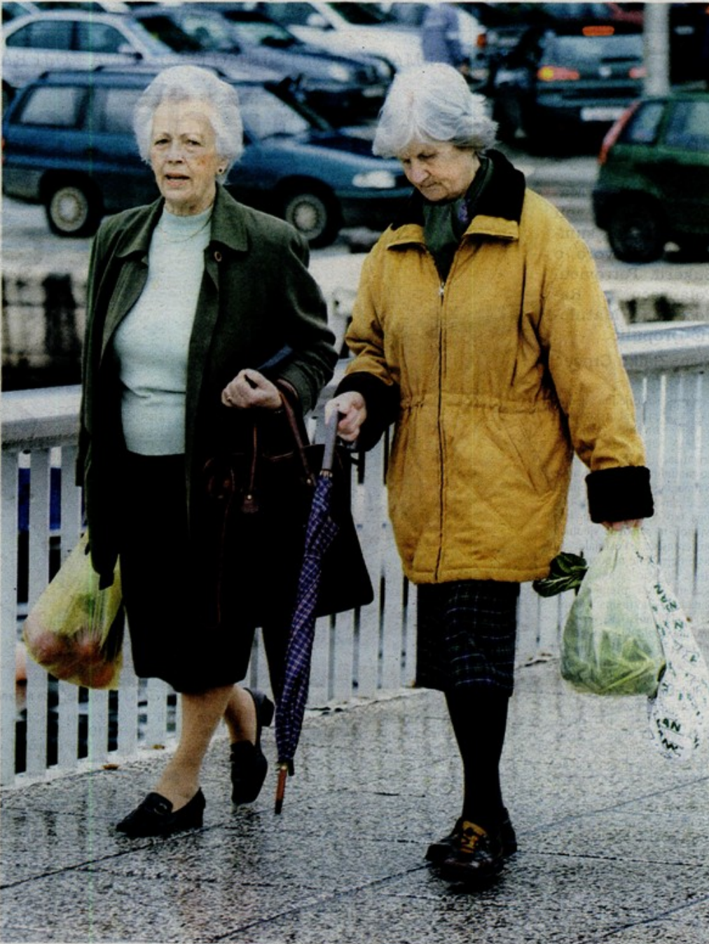
Umjesto na zaslužni odmor, u šezdesetima će žene još uvijek ići na posao

Zakonska dob umirovljenja i za muškarce i za žene je 65 godina u Belgiji, Danskoj, Njemačkoj, Španjolskoj, Irskoj, Cipru, Nizozemskoj, Portugalu. Niža dob umirovljenja određena je za oba spola u Francuskoj - 60, Finskoj - 63 i Litvi - 62 godine. U Češkoj i Slovačkoj žene koje su brinule o djeci mogu otići u mirovine nešto ranije. Rodne razlike postoje tek u nekoliko zemalja - u Bugarskoj - za muškarce 63, žene 59, Italiji - muškarci 63, žene 59, Velikoj Britaniji - muškarci 65, žene 60, Sloveniji - muškarci 63, žene 61, no i one ih nastoje ukinuti.