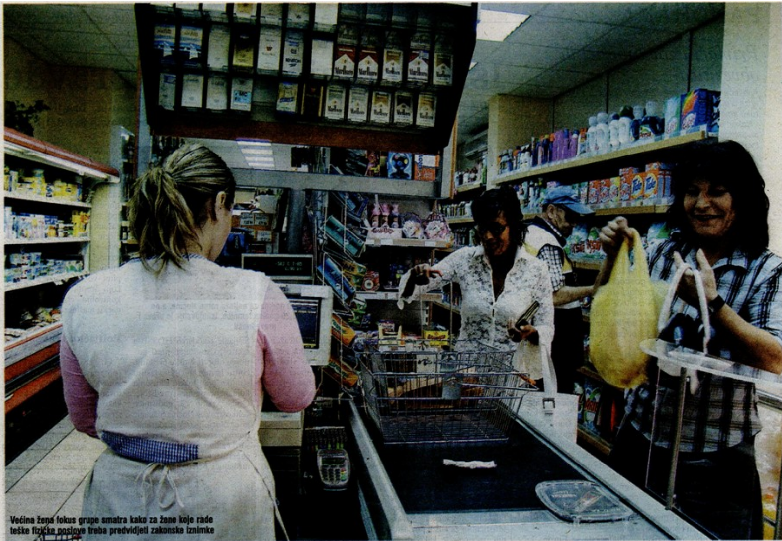
Većina žena fokus grupe smatra kako za žene koje rade teške fizičke poslove treba predvidjeti zakonske iznimke

MIROVINSKA REFORMA ILI KAKO SU HRVATI DOMISLILI NOVI PARADOKS